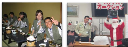
【 慰安旅行などレクリエーション各種 】