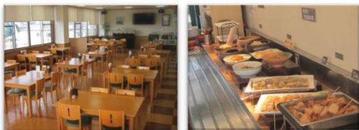
【 ランチのお店 ルポ 】